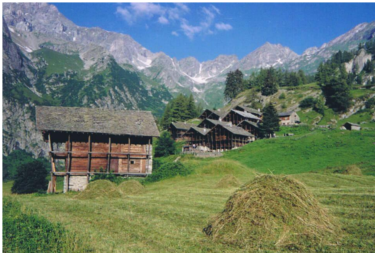
Follu e Ciucche